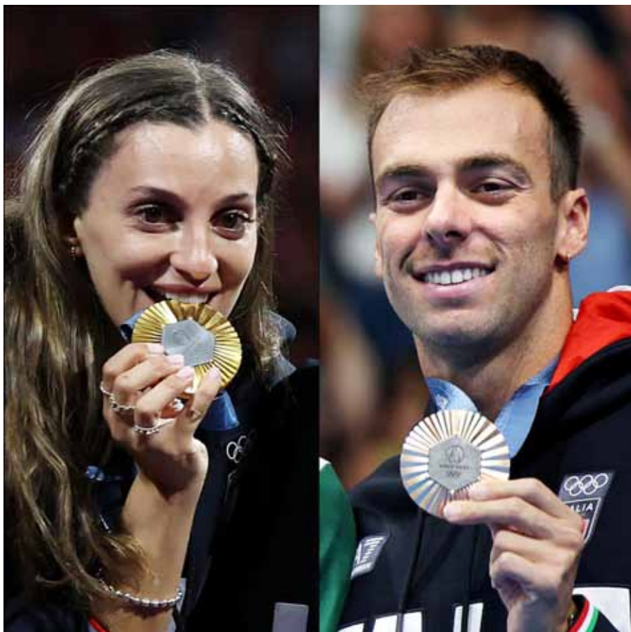
Paltrinieri e Flamingo

CRONACHE BOLOGNESI è pubblicato da MUSEOBOLOGNACALCIO.IT