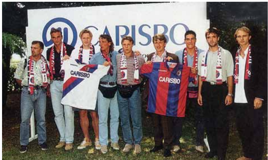
I nuovi volti della stagione sportiva 1996-97

ti come Miranda, Lucumì, Heggem e Zortea, integrati da elementi di esperienza come Casale e Di Lorenzo e dai recenti innesti di gennaio come Hlland e João Mário, ritiene che la difesa rossoblù abbia raggiunto il giusto equilibrio tra solidità e qualità?